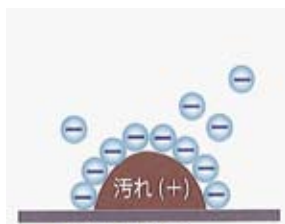
水より細かい粒子(マイナス電子)が間に入り込み浮かせます。