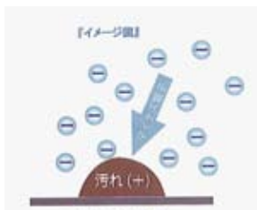
汚れた対象面にスプレーします。